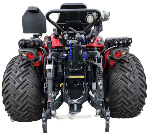
AFMETINGEN: wielen 320/70-18